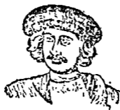
राजा राममोहन राय

आधुनिक भारत में नवचेतना के तत्व को सबसे पहले राजा राममोहन राय (सन् १७७४ से १८३३) ने ग्रहण किया। उन्होंने जनता को उपनिषदों की महा-